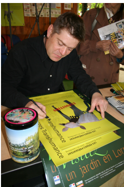
Séance de dédicaces - Sénat 2008

Vous souhaitez adopter une « Bestiole » ? .... demandez le matériel de marquage et venez la chercher le 16 octobre après la période de pâturage